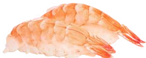
62. Ebi gambero* cotto