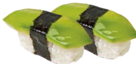
V 66. Avocado